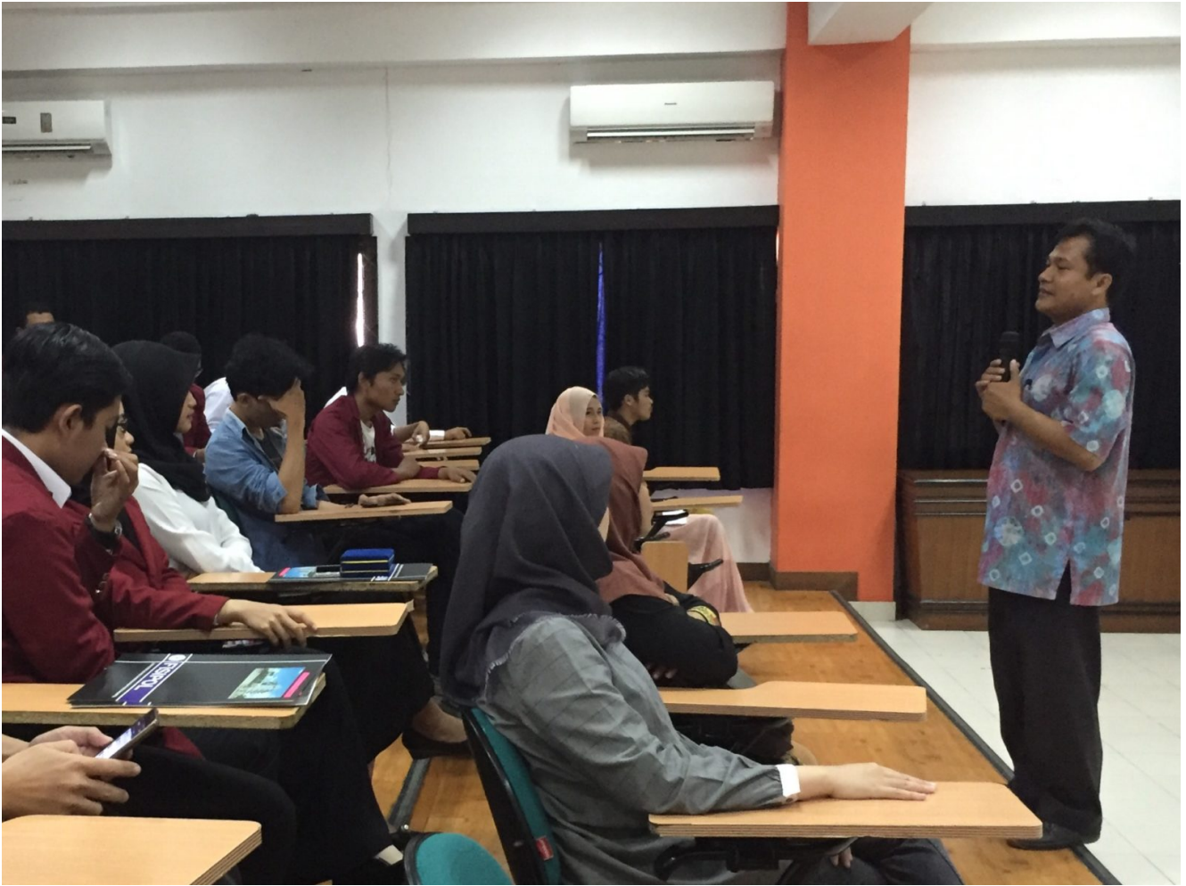
Ein Klassenzimmer mit Lehrern und Schülern

Außerdem wird auch eine kritische Medienkompetenz benötigt. Im Zeitalter der sozialen Medien beziehen Menschen ihre Informationen und ihr Wissen neben der klassischen Bildung aus den Massenmedien und den sozialen Medien. Versuche, Indonesier*innen Medienkompetenz zu vermitteln, sind bislang jedoch noch sehr oberflächlich. Der Fokus liegt nur darauf, ‚wahre‘ von ‚unwahren‘ Informationen zu unterscheiden. Es wird aber keine Erklärung dafür gegeben, wie man beurteilt, was wahr und falsch ist. Bisher sagt die indonesische Regierung beim Umgang mit heiklen Themen den Menschen nur, was ‚gut‘ und was ‚schlecht‘ sei. Dies ist eine äußerst positivistische Perspektive, weil sie eine autoritäre Denkweise fördert, bei der die Machthaber darüber entscheiden können, was eine Gesellschaft tun sollte, ohne Raum für kritische Analyse und alternative Lösungen zu bieten. In Bezug auf die Fähigkeit zum Umgang mit Medien können wir Buckingham (2007) Ansicht folgen. Er sagte, Kompetenz in diesem weiteren Sinne beinhalte Analyse, Evaluation und kritische Reflexion. Zum einen umfasst dies das Erarbeiten einer Meta-Sprache, das heißt, einen Weg, die Formen und Strukturen einer bestimmten Art und Weise der Kommunikation zu beschreiben.