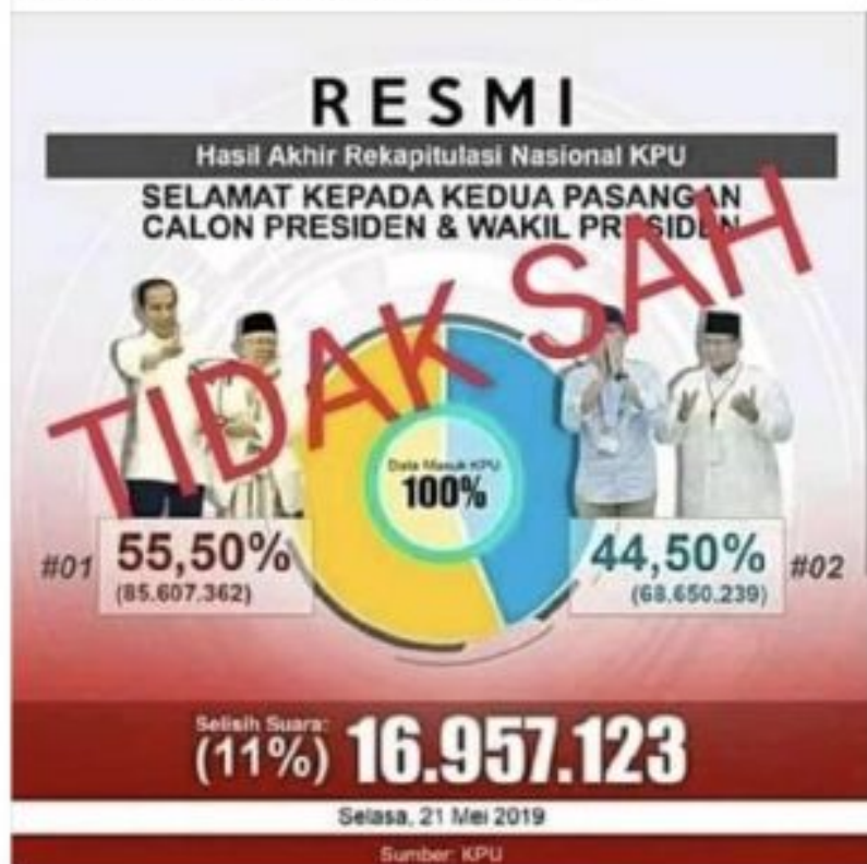
Infografik, die auf einem indonesischen Facebook-Account veröffentlicht wurde und die angeblich falschen Wahlergebnisse zeigt

Anstatt in einen Dialog zu treten, schaffte die Regierung einseitig Fakten, indem sie durch Verbote in den sozialen Medien festlegte, was gut und schlecht für die Gemeinschaft ist. Dies zeigt, dass weder die Regierung noch die Bürger*innen Indonesiens verstehen, was Demokratie bedeutet und sie auch nicht anwenden können. Von Seiten der Regierung wird dieses mangelnde Verständnis demokratischer Strukturen dadurch deutlich, dass Möglichkeiten des öffentlichen