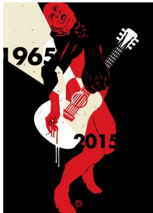
Unter den Ermordeten und Inhaftierten waren zahlreiche Intellektuelle: Lehrer*innen, Wissenschaftler*innen sowie Künstler*innen © Alit Ambara

Für die Militärs befeuerten diese Geistergeschichten auch die Angst vor der grausamen Rache der Menschen, die sie gefoltert, verletzt oder ermordet hatten. Die Geister der toten Häftlinge waren für sie eine unsichtbare und unkontrollierbare Bedrohung. Daran, dass die Militärs das Narrativ der