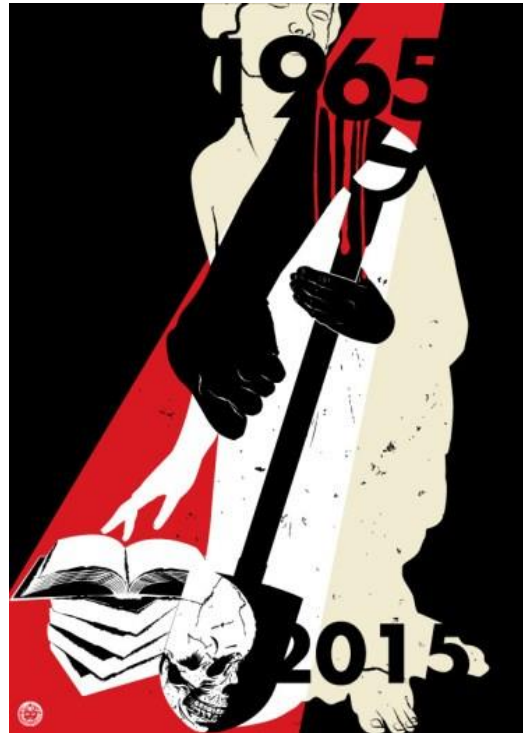
In Indonesiens Geschichtsbüchern ist noch immer die Version der Suharto-Zeit präsent. Sie lautet: Kommunisten stören die soziale Harmonie

Der Landkreis Jembrana auf der Insel Bali war vor 1965 eine starke Basis der Kommunistischen Partei Indonesiens (PKI). Aus diesem Grund ereigneten sich dort besonders viele Morde an Menschen, die einer kommunistischen Weltanschauung verdächtigt wurden. 50 Jahre nach den Gewalttaten von 1965 und 17 Jahre nach dem Ende von Suhartos "neuer Ordnung" (1965 – 1998), geschah in Jembrana etwas Interessantes. Im Dorf Masean (Batuagung) wurde das traditionelle Ritual ngaben durchgeführt. Bei diesem Ritual auf Bali, wo die Mehrheit der Einwohner dem hinduistischen Glauben angehören, werden Leichname verbrannt, um die Seelen der Toten von den Makeln ihrer physischen Existenz zu reinigen. So geschah es 2015 auch mit den sterblichen Überresten von einigen Opfern der Massenmorde. Die lokale Gemeinschaft entschied sich zu diesem Schritt, nachdem viele Menschen von Angst und Besorgnis umgetrieben worden waren.