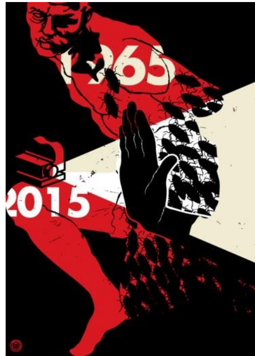
50 Jahre danach erinnert Alit Ambara an die grausamen Gewalttaten von 1965

Ob die Geister der Verstorbenen gut oder schlecht sind, hängt davon ab, wie sie von der Lebenswelt in die ewige Welt übergehen, sprich: mit ihrer Todesursache, zusammen. Ein natürlicher Tod ist ein Tod nach Gottes Willen. Es ist ein guter Tod, aus dem ein guter Geist hervorgeht. Ein nicht natürlicher Tod, sei es durch einen Unfall, durch Mord oder Selbstmord, ist ein